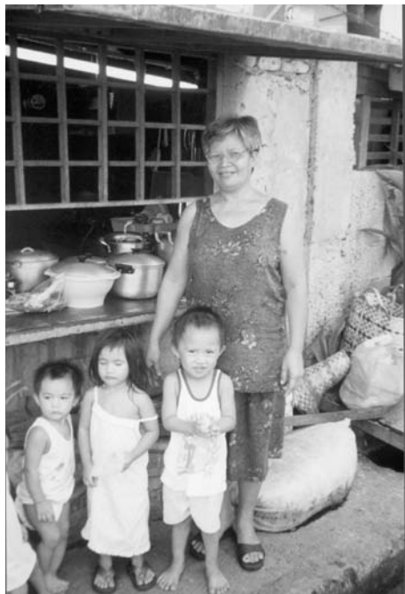
Senyang, en av ESUL:s mikrokredittagare vid sitt gatukök i Pandacan, Manila

Stiftelsen ESUL:s vänner Januari 2002 Nummer 8