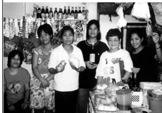
Sju av låntagarna i Pandacan i honungs-försäljarens butik.

är beroende av 4 lånehajar. De bekräftar alltså att ett förkrossande antal av de som bedriver småskalig affärsverksamhet i deras område är beroende av lånehajarna för sin verksamhet. De har knappast något val. Förutom en handfull av frivilligorganisationer och några statliga byråer med begränsade lån, så är det lånehajarna som kan ge de mest tillgängliga, om än omoraliska, lånen till de små företagsamma fattiga. Vi hoppas att vi framgenom tillsammans med organisationerna ska kunna utarbeta ännu bättre riktlinjer och avbetalningsmöjligheter som gör vårt stöd bra för alla parter.